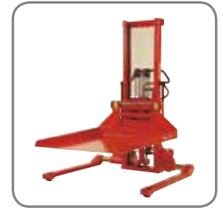
Options d'échange rapide : Bras de grue, éperon, plate-forme, retourneur bobines, pince bobine, retourneur de fûts.