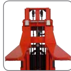
Grâce au système d'échange rapide, il est simple et rapide d'effectuer des remplacements entre les fourches et les accessoires complémentaires.