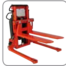
Les fourches se montent sur tous gerbeurs Logiflex avec ou sans longerons encadrants.

Fourches pleines : Fourches fines pour la préhension de palettes basses.